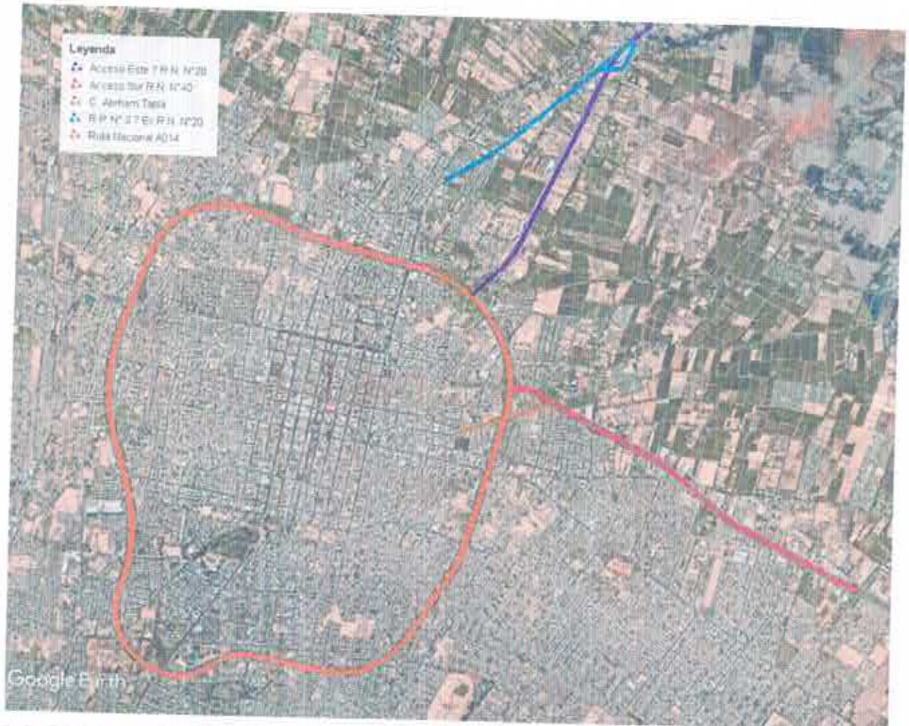
Figura 1. "Sistema de alumbrado público Ruta Nacional A014".