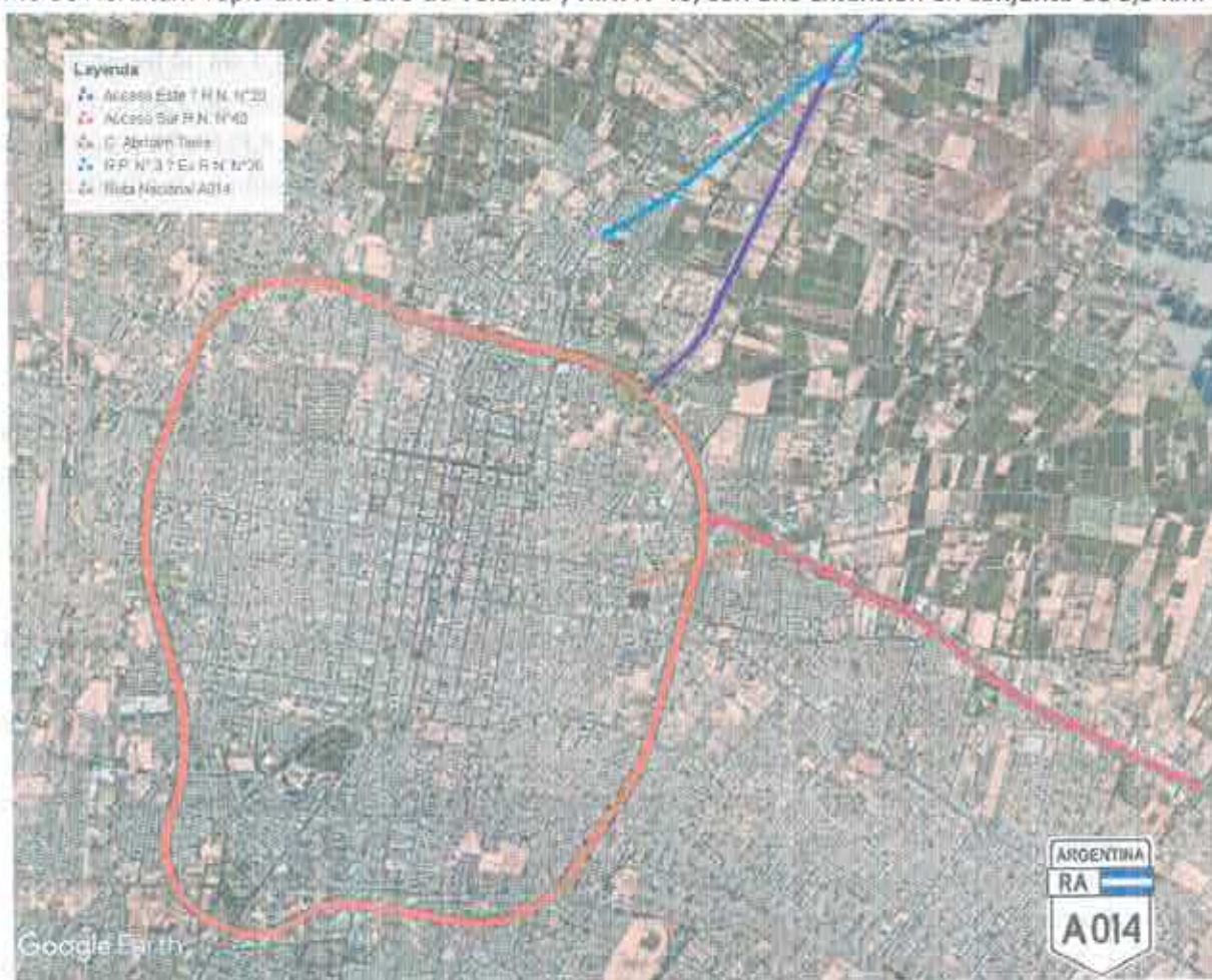
Figura 1. R.N. A014 – "Av. De Circunvalación F. Cantoni" y Accesos principales.

El mantenimiento se desarrollará sobre la traza principal de la Ruta Nacional A014 "Av. Circunvalación Dr. Federico Cantoni" con una extensión total de 16km, será incluido en el servicio el Acceso Este – R.N. N°20 comprendido entre RN. A014 y Calle 21 de febrero, con una extensión de 3,7 km, el tramo de la R.P. N°3 – Ex R.N. N°20 desde Av. Hipólito Yrigoyen hasta R.N. N°20, con una extensión de 2,85 Km. y finalmente el tramo del Acceso Sur R.N. N°40, comprendido entre Fray M. Esquilu hasta la R.P. N°155 (Calle 5) sumando el tramo de Abraham Tapia entre Pedro de Valdivia y R.N. N°40, con una extensión en conjunto de 6,3 km.